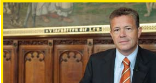
Frank Vanhecke is niet van plan zich de mond te laten snoeren.