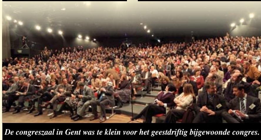
De congreszaal in Gent was te klein voor het geestdriftig bijgewoonde congres.