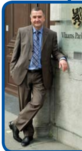
Karim Van Overmeire Vlaams Parlementslid Lijsttrekker 2009

deren op eigen kracht' en met de campagnes die nog zullen volgen wil het Vlaams Belang de ijsbreker zijn die de route naar onafhankelijkheid open breekt. Wij rekenen op uw steun.